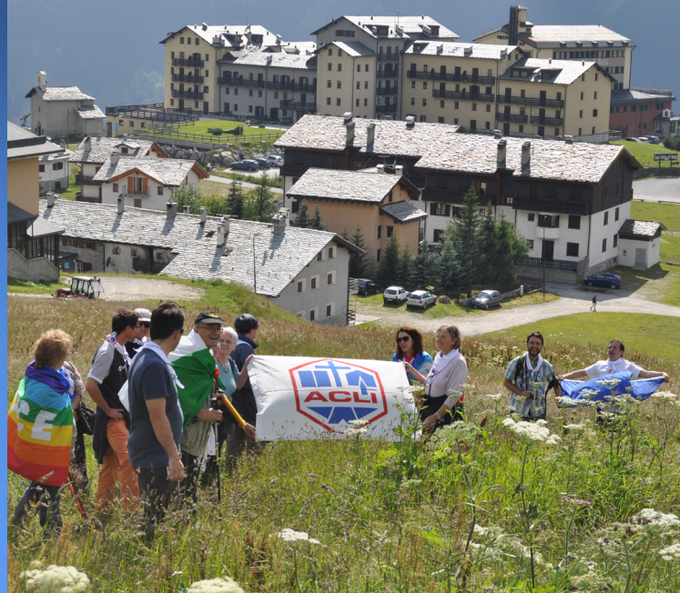
La Casa Alpina di Motta